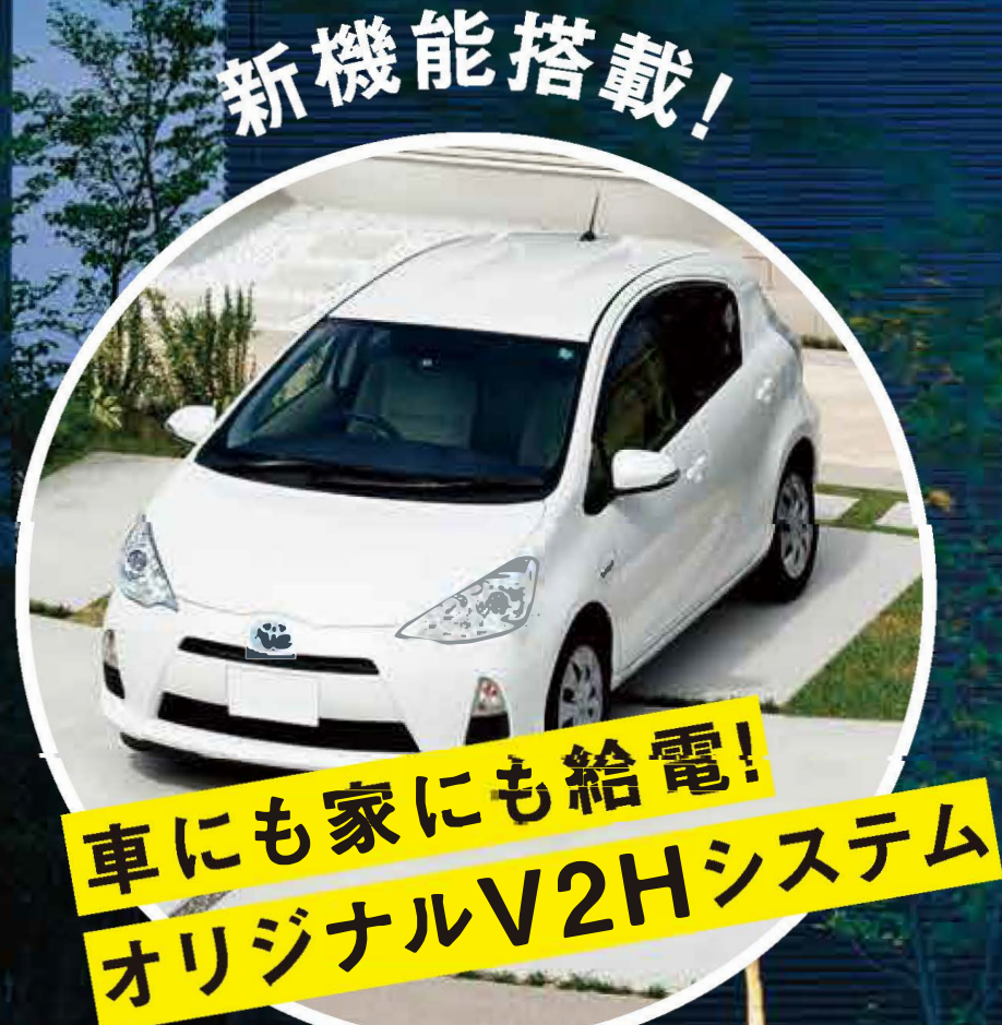
*車の画像はイメージです。