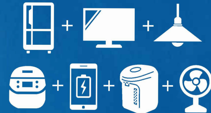
*季節、天候、使用状況等により異なります。

停電時、一条オリジナルのパワコンは、太陽光パネルが発電した電力最大5.5kWを家全体に供給可能。日の沈んだ夜間も蓄電池が電気を供給し、普段とほぼ変わらない生活*が実現出来ます。