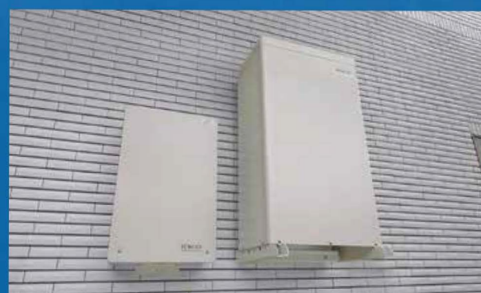
*電池自体の期待寿命。蓄電システム自体の寿命を示すものではありません。

一般的な三元系リチウムイオン蓄電池と比べ約2倍の充放電サイクルを実現した電池の開発に成功しました。先々の設備費用の再負担を抑え、「賢く電気を使う暮らし」が続きます。